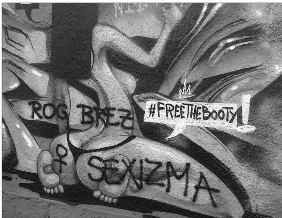
»Rog brez seksizma!« Grafit na zunanjem zidu Roga, Trubarjeva ulica, 1. 9. 2016.

»Ne, ena feministka, ki je na poti domov videla to estetiko šovinizma. Stekla je po sprej in pustila politično sled.« »Ja, pa saj grafit je že sam po sebi političen. Če si ga pa lahko nanj še kdo zdrka, pa toliko bolje. Tvoji grafiterki je samo dolgčas, ker je noben ne pofuka.« »Veš kaj, mojo grafiterko fukajo tako moški kot ženske in vsi drugi spoli, predvsem pa ona fuka njih, nadvse pošteno. In rada je zgoraj. Če še nisi opazil, si ti tudi spodaj, jaz pa na tebi. Jaz ne cenzuriram, jaz interveniram!«