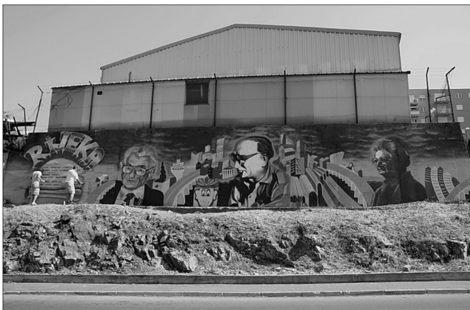
Mural Mesto Baltazar i reški profesorji , junij 2012

Lokacija je enako pomembna zato, da senzibilizira vse več ljudi za take projekte, ki se tako začnejo neustavljivo širiti. Zame je bila najpomembnejša lokacija na Mihanovičevi – in sam Mihanović, ker se ime ulice neposredno ujema z opravljenim enciklopedijskim vnosom. (Gustin, intervju, 2015)