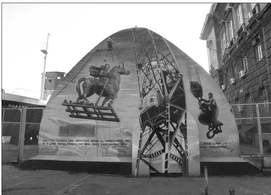
Mural Glasnica miru , marec 2012