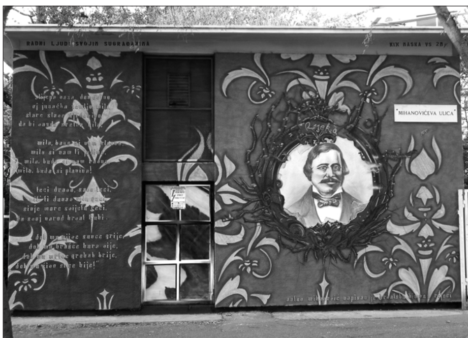
Mural Antun Mihanović, julij 2014

Rečana, dobitnika prve zlate medalje za neodvisno Hrvaško na svetovnem prvenstvu v full contactu in kick boxingu , ki je bilo od 6. do 8. decembra 1991 v Parizu. Toda dve leti pozneje je lastnik objekta poslikavo prebarval. V tem kontekstu se postavlja vprašanje, zakaj murali ne veljajo za umetniško materialno dobrino, ki se ne bi smela izbrisati? Če ostanemo pri Reki, murali so predvsem kulturni izdelki, ki so jih financirali prebivalci mesta sami in jih namenili svojim someščanom. Zakaj ne brišemo umetnosti, ki je institucionalizirana, formalna in klasična? Zdi se, da najpogosteje obstane in je zaščiten tisto delo, ki se afirmira v določenih ideoloških okvirih in ki je povezano s tradicionalnim socio-političnim razvojem urbanizma, ter da se dejavnosti street arta še vedno potiskajo na obrobje družbe. Z vzpostavljenim komunikacijskim procesom, ki nastane s prenosom sporočil prek muralov, se želi dekonstruirati vnaprej določena stališča o različnih dejavnostih, pomembno vlogo pa ima aktivnost udeležencev, kar poudarja dinamičnost grafitov, a tudi njihovo izpostavljenost spremembam (Botica, 2001).