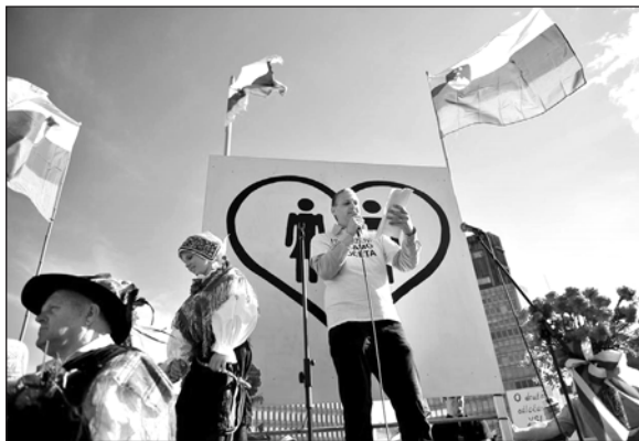
Slika 1: Shod koalicije Za otroke gre! marca 2015.

Najpogosteje je homoseksualnost uokvirjena kot grožnja otrokom. Uradni moto CIDPO je bil »hvaležen za mamo in očeta«, pri čemer sta bila mama in oče razumljena kot ekskluzivna biološka kategorija, moralno in drugače superiorna vsem drugim oblikam skrbi za otroke, še zlasti socialnemu starševstvu. Biološko starševstvo je bilo skozi njihovo interpretacijo razumljeno kot najboljša oblika starševstva, socialno starševstvo pa le kot njen približek, rešitev v sili, ki je v nekaterih primerih, kot so istospolne družine, za otroke celo nevaren. CIDPO je to pojasnjevala s posebnim, domnevno hedonističnim življenjskim slogom homoseksualcev, ki ni skladen